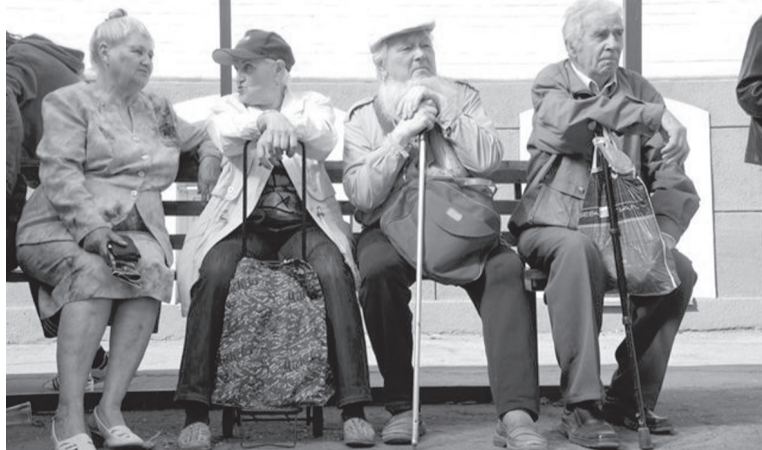
По всем возникающим вопросам обращаться по адресу: ул. С. Перовской, д. 78, каб. № 6, 9, 10. Тел. 49-524, 49-931, 49-561.

Подавать какие-то заявления на выплату не требуется, средства будут перечислены всем пенсионерам вместе с пенсиями за январь 2017 года.