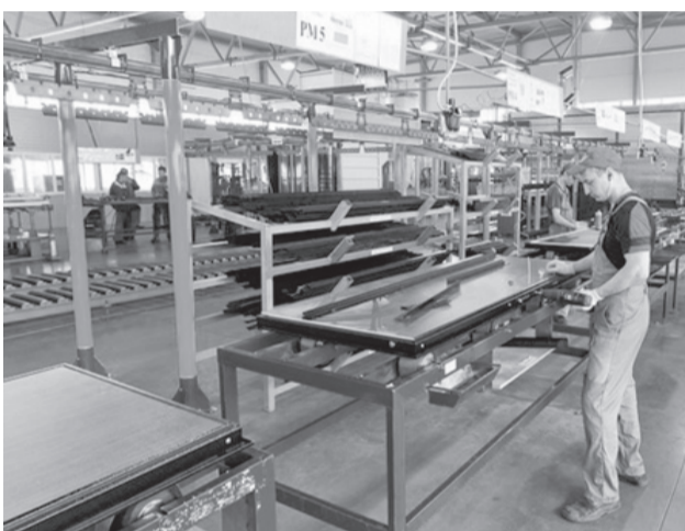
Производственный цех «Эльбора»

«Эльбор» изготовил на своих станках. Новые мощности позволяют заводу войти в отечественную тройку лидеров по выпуску стальных дверей, а по выпуску замков повышенной стойкости «Эльбор» уже давно занимает одно из ведущих мест на постсоветском пространстве.